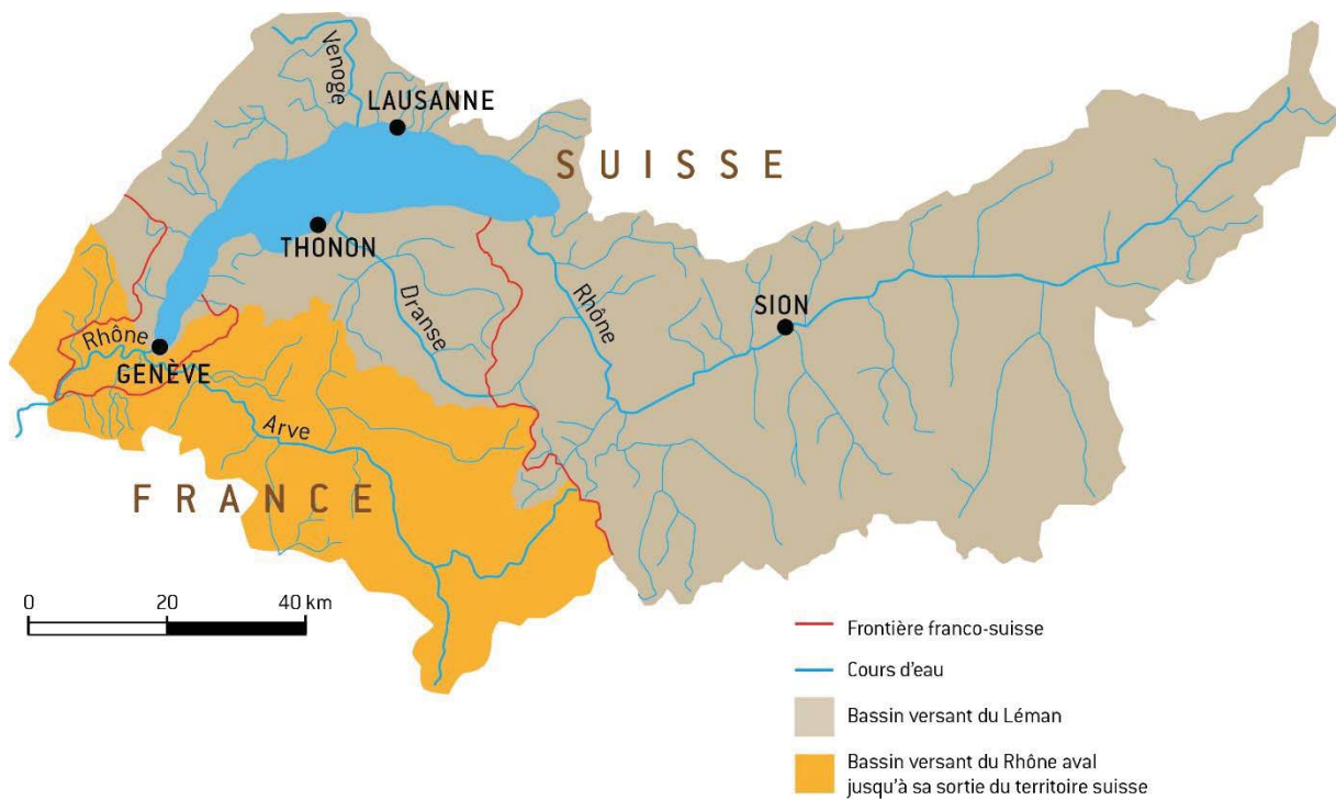
Figure 2 : Le bassin versant du Léman et du Rhône aval jusqu'à la frontière franco-suisse de Chancy