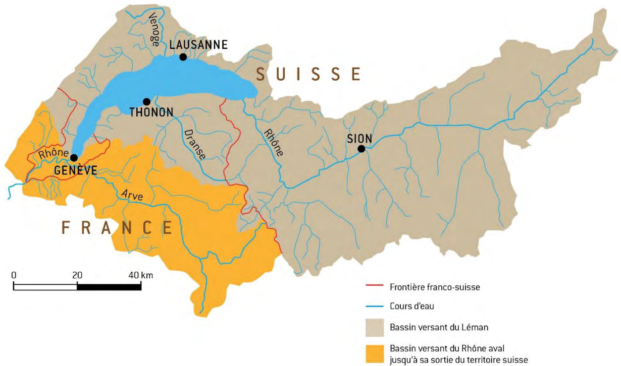
Figure 2 : Le bassin versant du Léman et du Rhône aval jusqu'à la frontière franco-suisse de Chancy