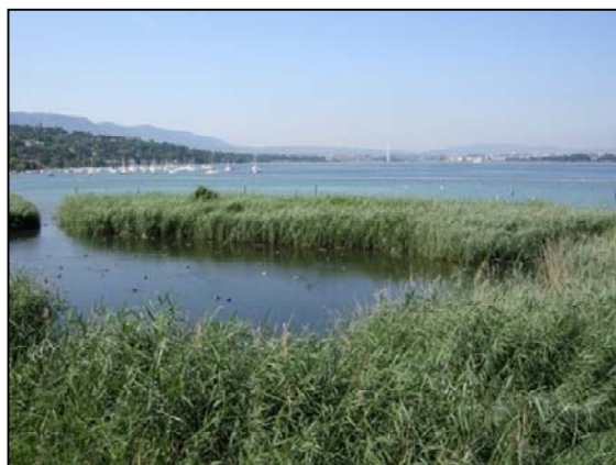
La Pointe à la Bise (GE)