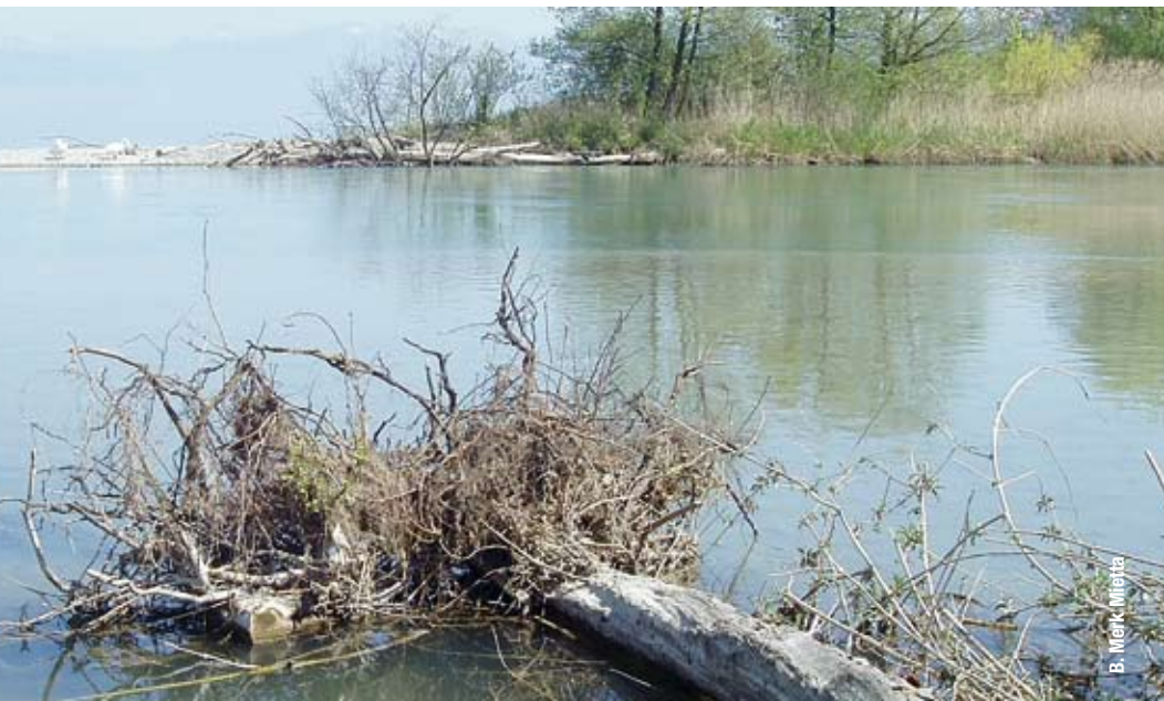
Delta de la Dranse